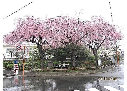
大佛鉄道記念公園の枝垂れ桜