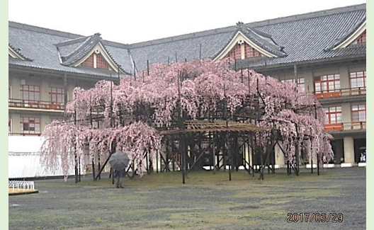
天理教本部の枝垂れ桜